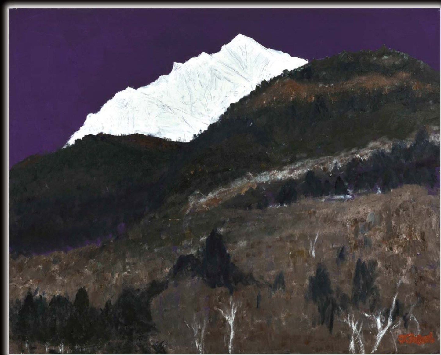
「聖母マリアのような冬の大山」F100 (画・深見東州)