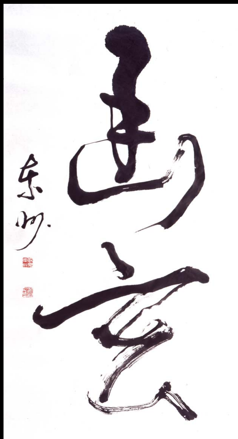
「幽玄」縦136cm×横69cm (書・深見東州)