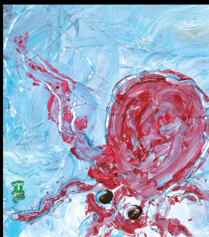
「北斎の春画から抜け出したタコ」 色紙 (画・深見東州)