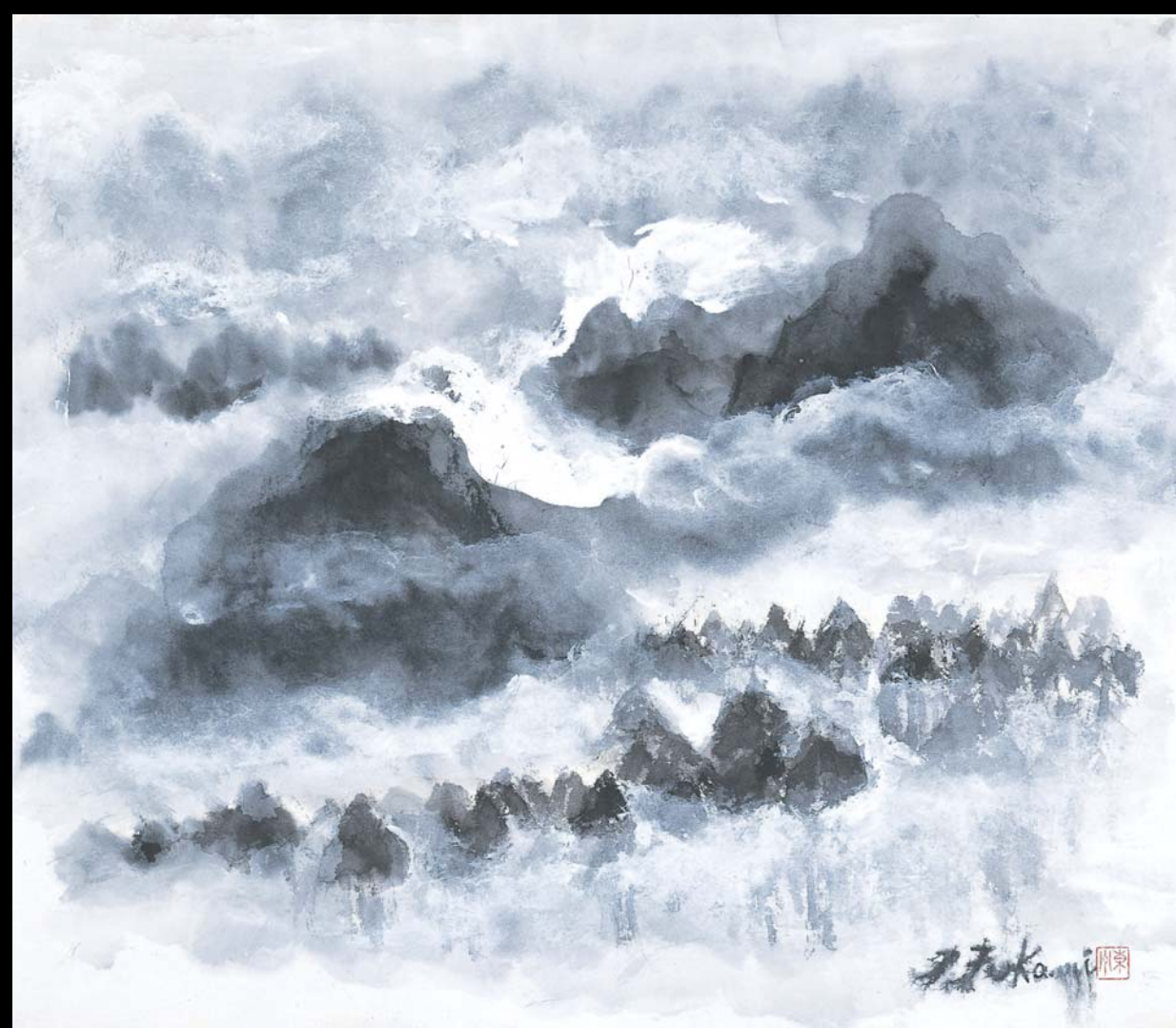
「霧に隠れる山と杉」F10 (画・深見東州)

アクセス JR・都営地下鉄「五反田駅」より徒歩10分 ※五反田駅から、無料シャトルバスを運行します。