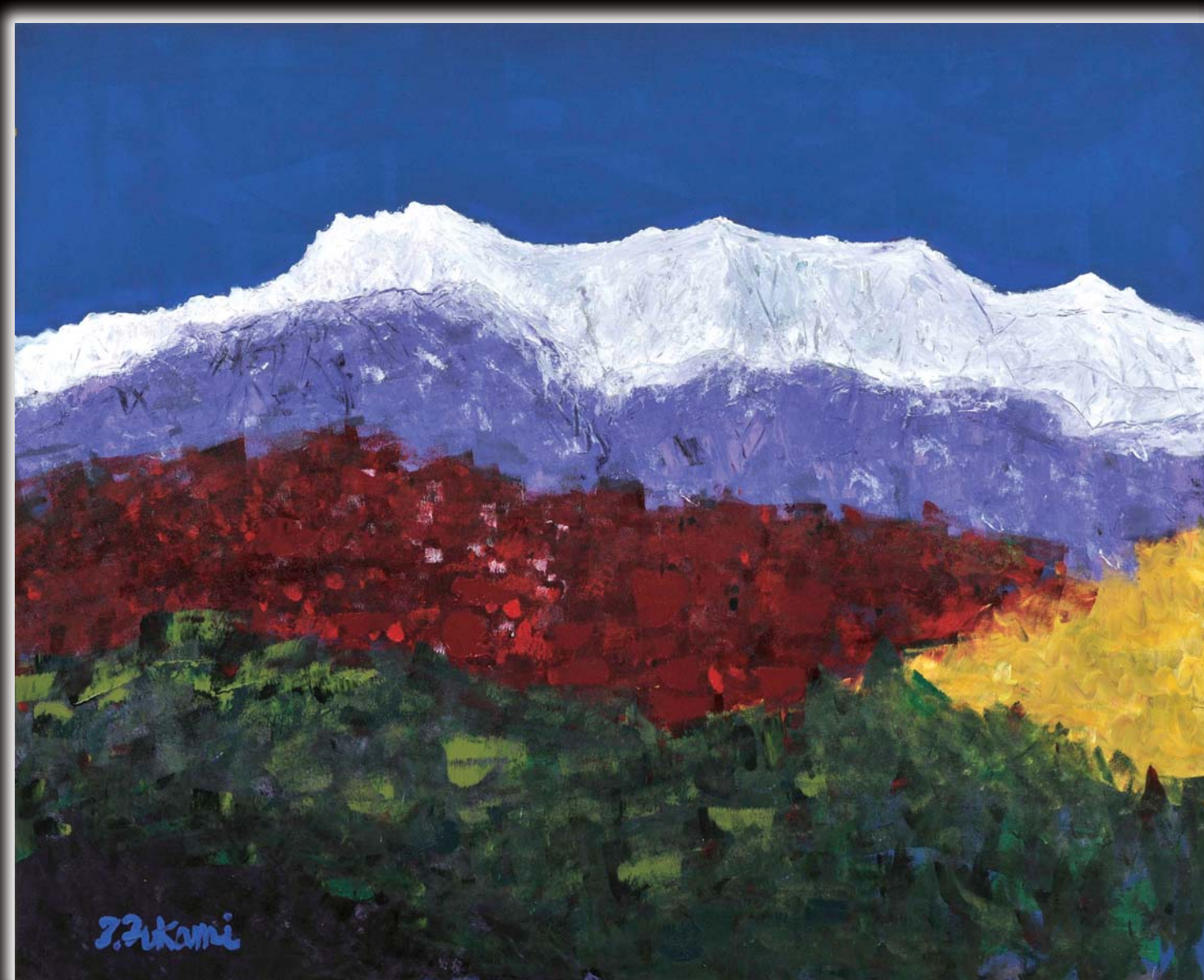
「石鎚山は五色のめぐみ」F100 (画・深見東州)